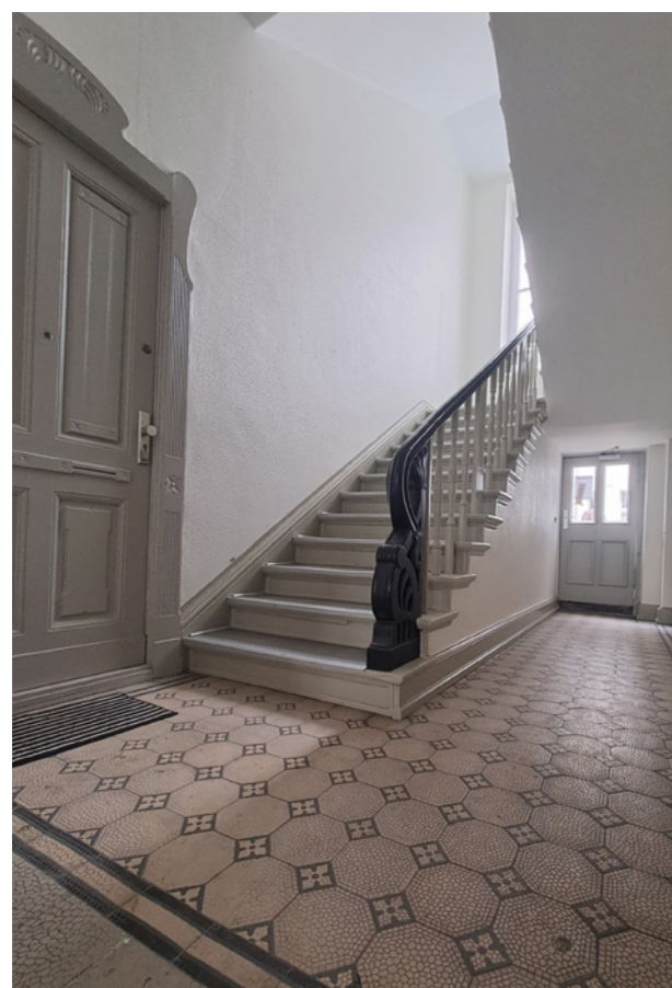
Neugestaltetes Treppenhaus in unserer Wohnanlage Donaustraße 108-109