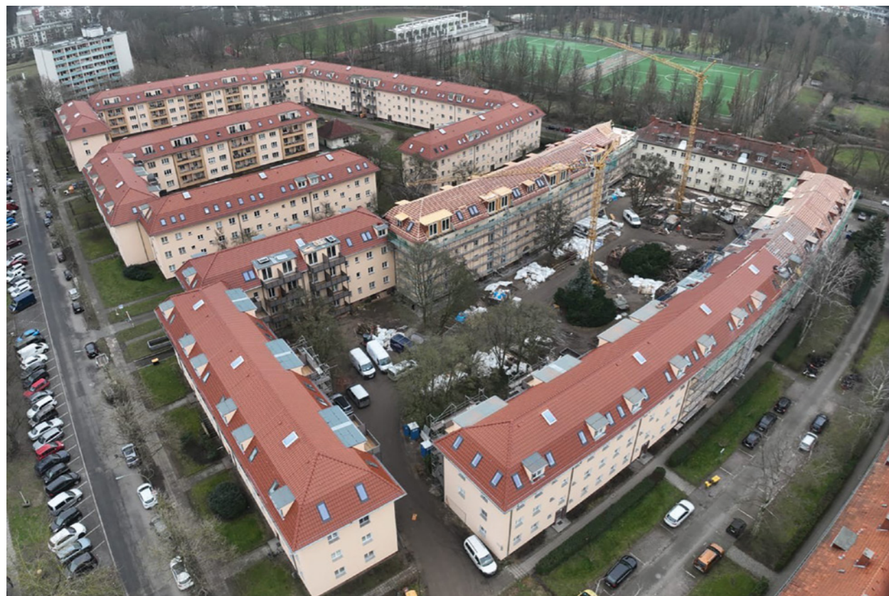
Unsere Baustelle im zweiten Bauabschnitt in Mariendorf aus der Vogelperspektive