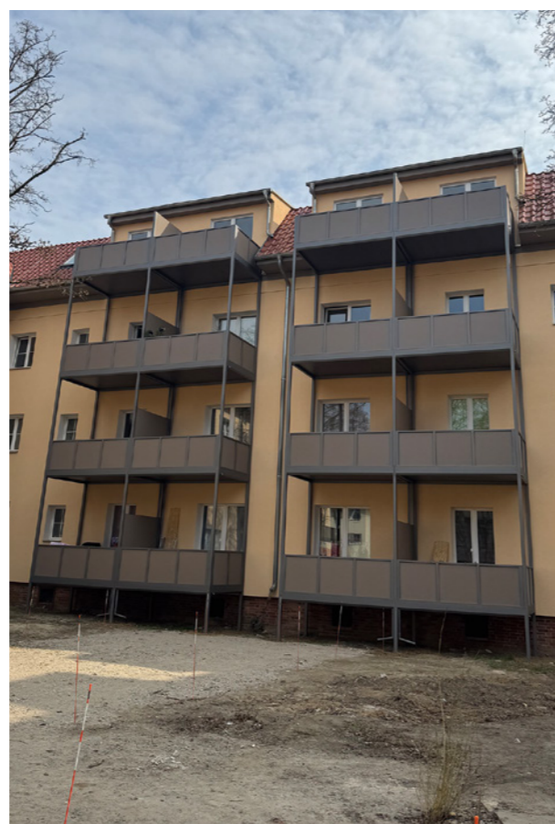
Balkonanbau im zweiten Bauabschnitt Mariendorf im Westphalweg